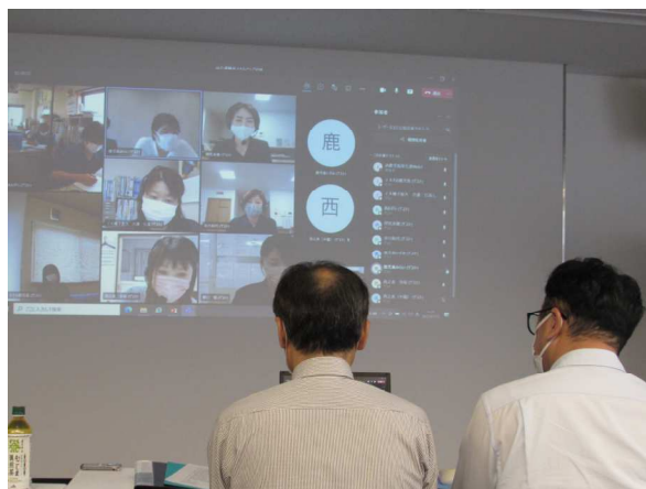
リモートでの意見交換の様子